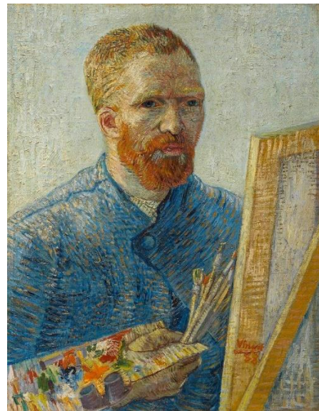
Аутопортрет испред штафелаја